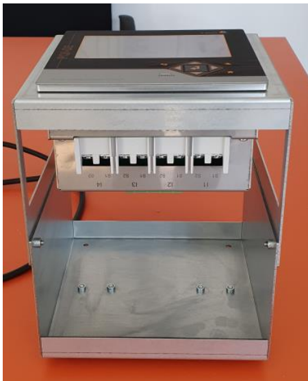
Ansicht unten – Lang geschraubt 21 cm Aufbauhöhe