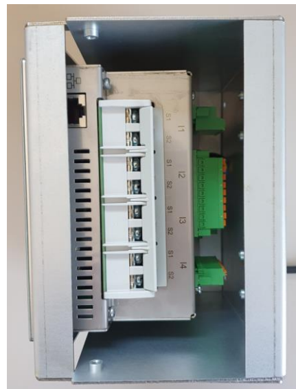
Ansicht unten – Kurz geschraubt (13cm Aufbauhöhe)