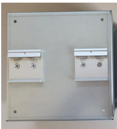
Ansicht Rückseite – mit Hutschienenadapter